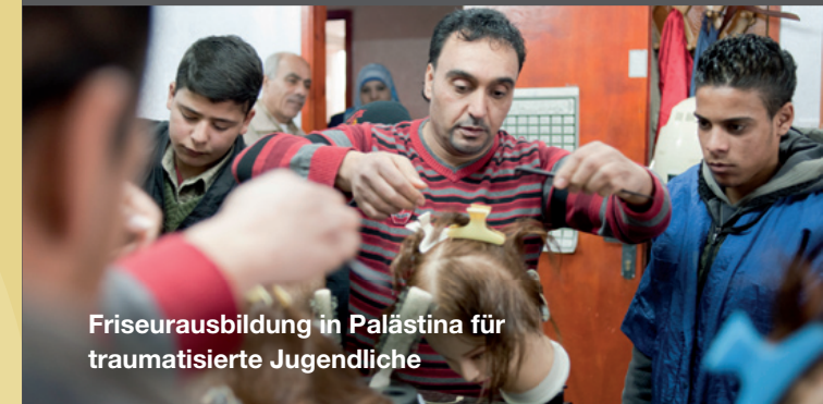
Friseurausbildung in Palästina für traumatisierte Jugendliche