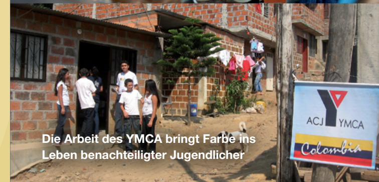
Die Arbeit des YMCA bringt Farbe ins Leben benachteiligter Jugendlicher