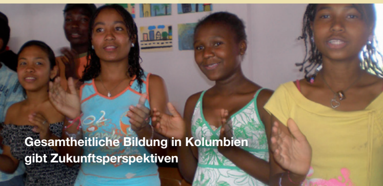
Gesamtheitliche Bildung in Kolumbien gibt Zukunftsperspektiven

Horyzon unterstützt das Programm 2012 mit einem Beitrag von CHF 270'000.–