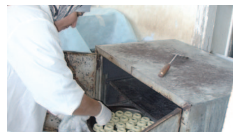
Production de pains et de pâtisseries qui seront vendus aux traiteurs et à l'occasion de différents événements.

Le projet YMCA d'aide à l'autonomie financière offre aux femmes des milieux défavorisés des emplois formateurs. Horyzon a soutenu le projet pendant plusieurs années, jusque fin 2010. Elle apporte désormais son aide aux YMCA Palestine, aujourd'hui chargées de sa mise en œuvre.