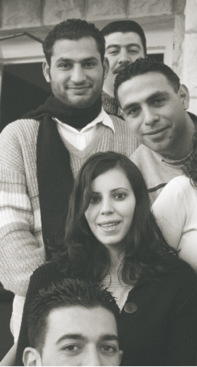
Confiants malgré la situation difficile : le groupe «Jeunesse pour la paix et le développement» s'engage pour une paix juste en Palestine.